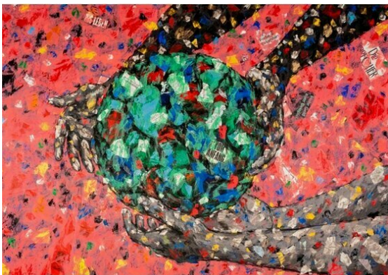
Das Misereor-Hungertuch 2023 „Was ist uns heilig?“ von Emeka Udemba.

Aktuelles Misereor-Hungertuch mit dem Titel „Was ist uns heilig?“